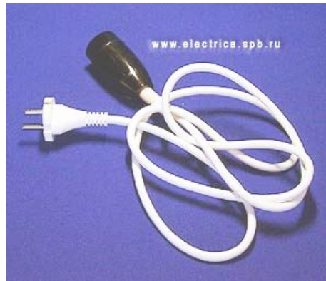
איור מס' 1 פתיל זינה המתאים למוצר המוזן ממנו.