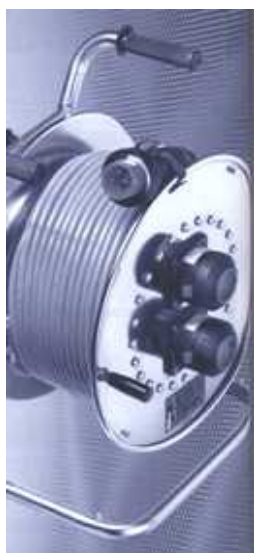
איור מס' 6 – תוף וכבל מאריך לאווירה נפיצה