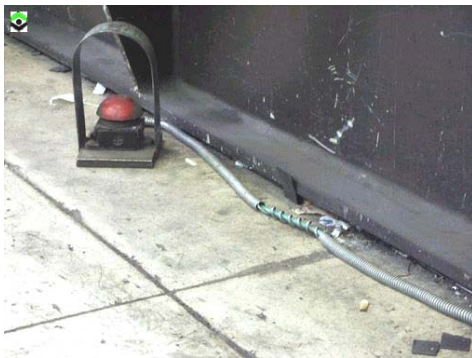
איור מס' 3 צינור מתכתי גמיש להגנה על כבל מאריך (הגנה כזאת אסורה)

הגנה מכנית על כבלי מאריך ופתילי זינה (איור 7.8): אין להשתמש בצינור גמיש ממתכת כהגנה על מוליכי זינה של מכשיר חשמלי מיטלטל (ראה איור מס' 3).